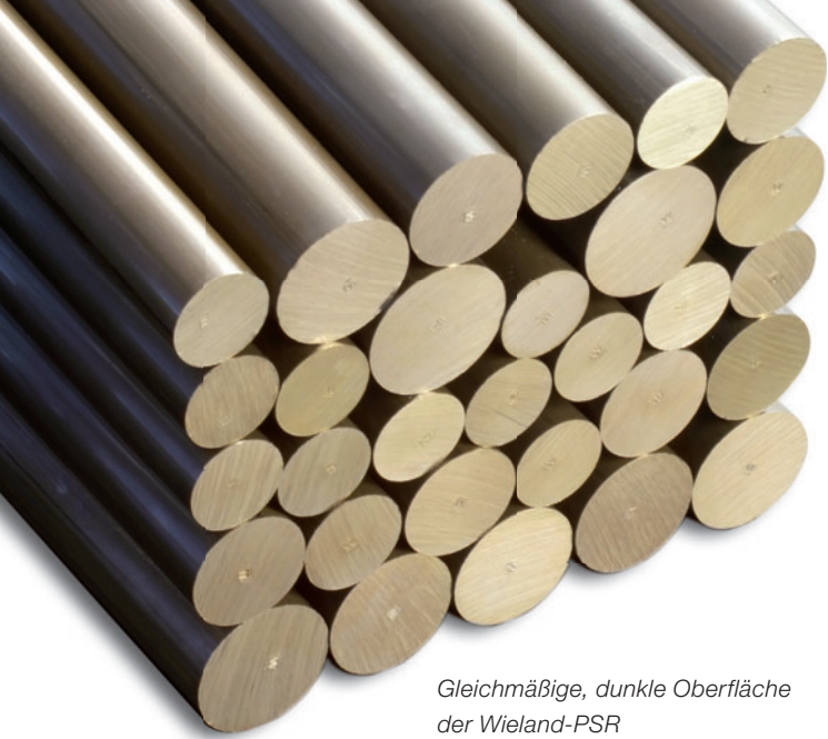
Gleichmäßige, dunkle Oberfläche der Wieland-PSR