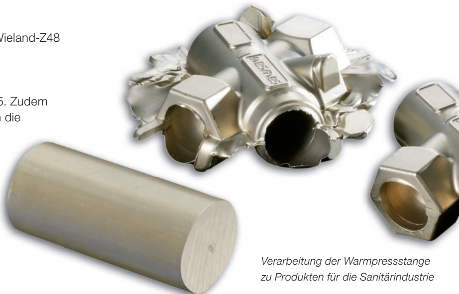
Verarbeitung der Warmpressstange zu Produkten für die Sanitärindustrie

Bereits seit 1987 hat Wieland ein zertifiziertes QM-System. Seitdem wurde es konsequent weiterentwickelt und heute ist Wieland nach DIN EN ISO 9001-2008 zertifiziert. Ebenso anspruchsvoll sind unsere Vorgaben für den Umweltschutz. Unsere Produktionsstätten sind nach DIN EN ISO 14001 zertifiziert und zudem nach dem europäischen Umweltstandard EMAS II validiert.